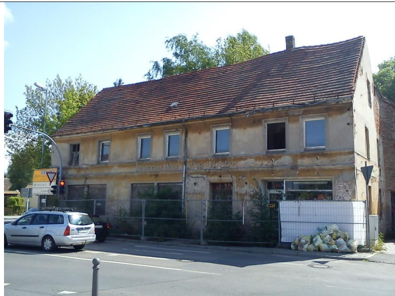
Bild vor Sanierung

Höhe des Einsatzes von Fördermitteln 615.000 €